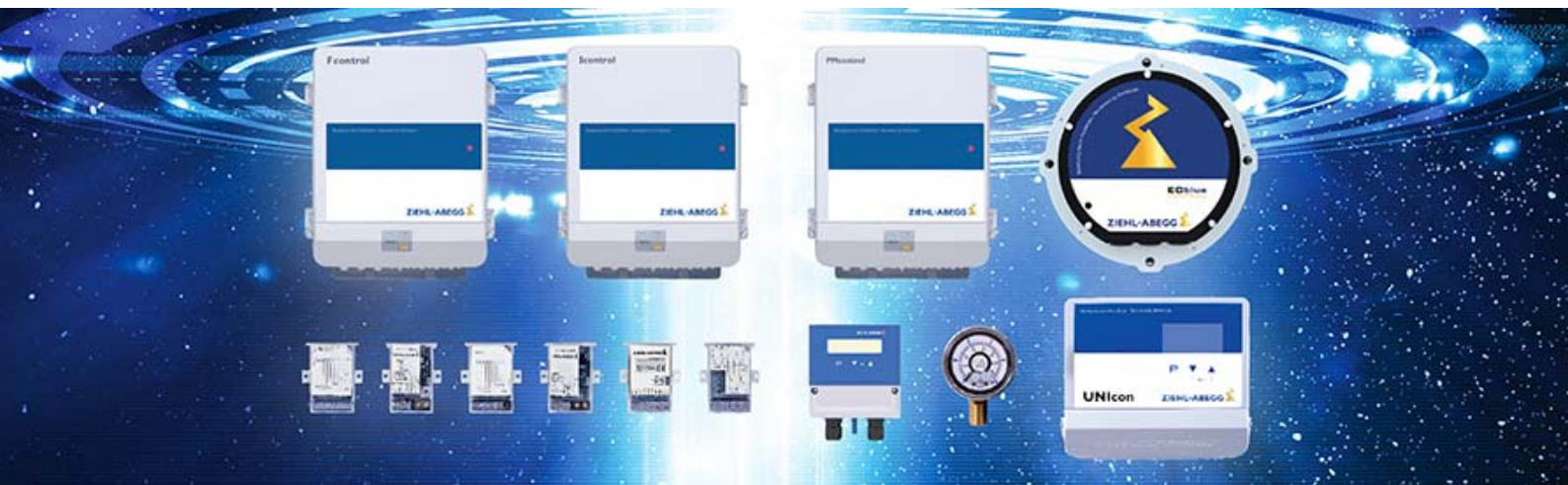
The Royal League in ventilation, control and drive technology